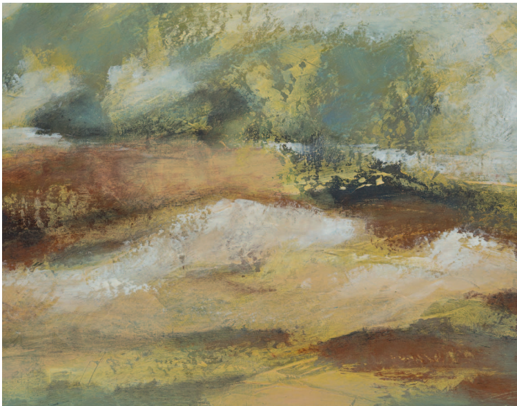
Landscape I (Ausschnitt) | Uta Oesterheld-Petry